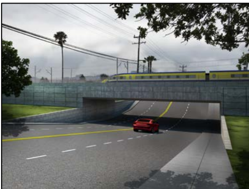
*Sonora-ի Մակարդակի բաժանում – Անցում վերևից Միայն հայեցակարգային պատկերման համար

Մակարդակի բաժանումը՝ դա ճանապարհ է, որն անցնում է երկաթուղային ռելսուղիների վրայով կամ տակով՝ անվտանգությունն ու շարժունակությունը բարելավելու համար: