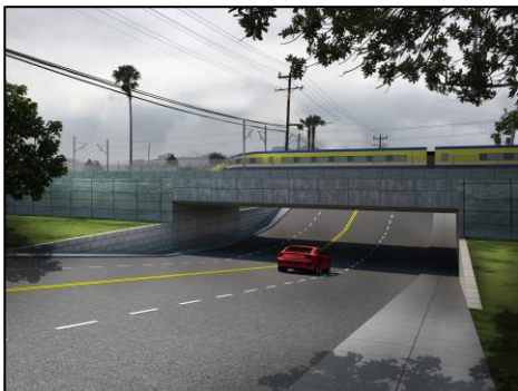
*Paso a desnivel para el Tren de Alta Velocidad - Cruce elevado Sólo ilustración conceptual

Un paso a desnivel es una calzada que es realineada sobre o debajo de una vía férrea para mejorar la seguridad y la movilidad.