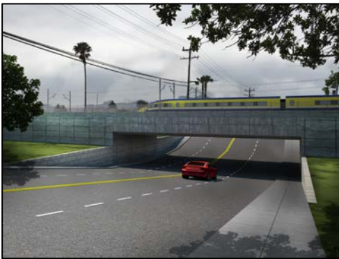
*Paso a desnivel de Sonora Avenue - Cruce elevado Sólo ilustración conceptual

Un paso a desnivel es una calzada que es realineada sobre o debajo de una vía férrea para mejorar la seguridad y la movilidad.