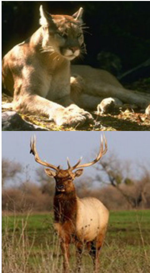
圖 5. 生活在帕切科關隘地區的生物有很多，圖中顯示的美洲獅和圖勒麋鹿是其中的兩種。