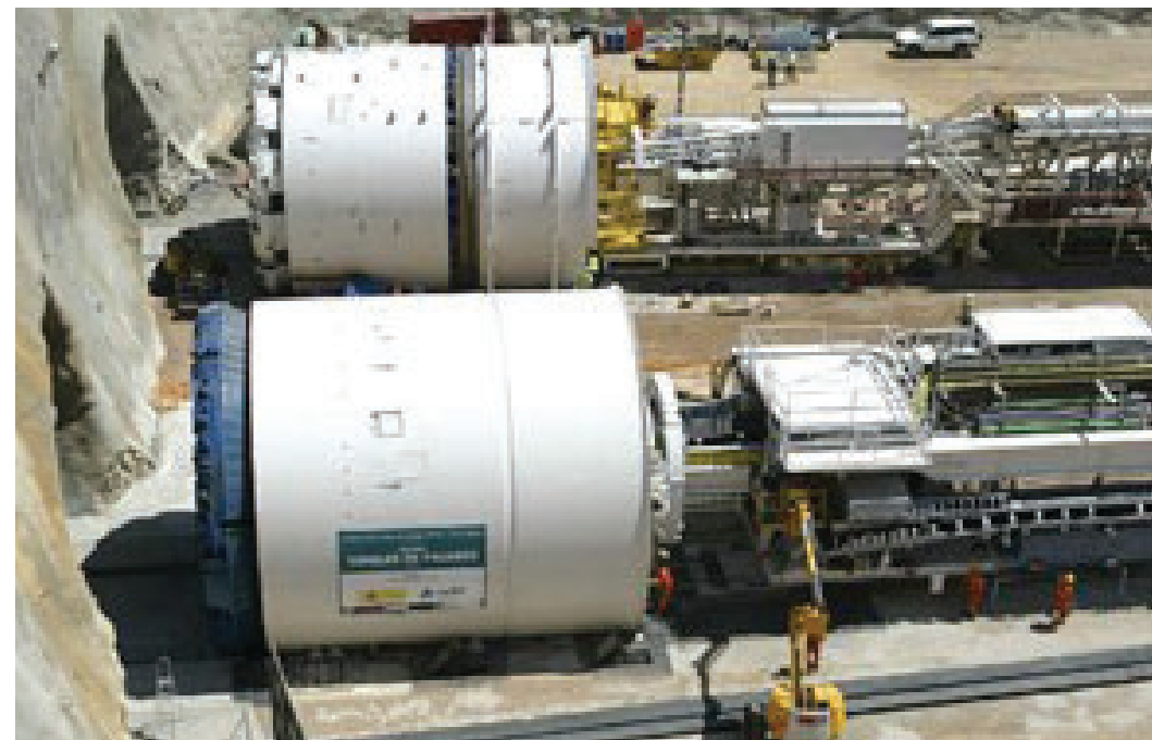
圖 3. 用於修建雙孔隧道的隧道掘進機。