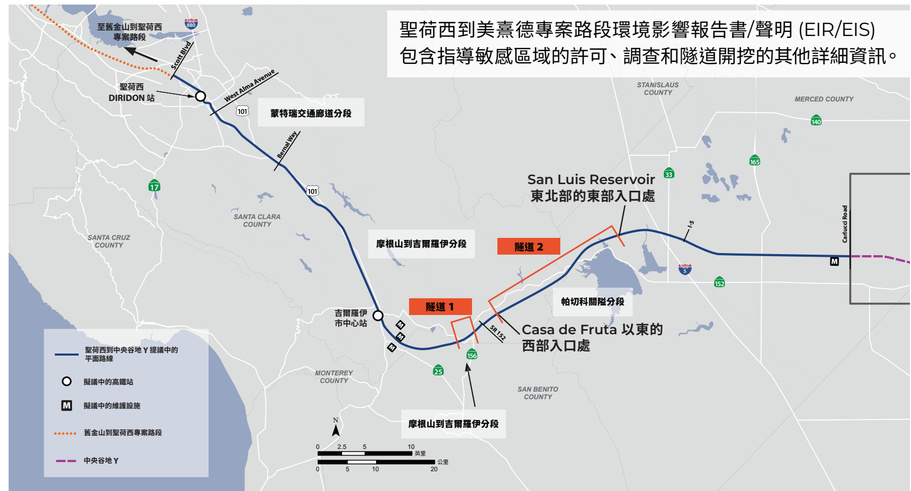
圖 1. 圖中顯示的是聖荷西到美熹德專案路段中兩條擬建隧道的位置。