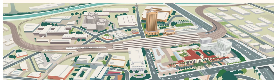
Fotos propuestas de link Union Station

el sur de california se encuentra 4 de 10 de las ciudades mas grandes del estado, cual va ser conectado por el ferrocarril de alta velocidad