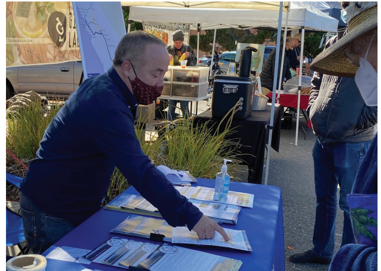
圖 1. 管理局工作人員到地方農貿市場設攤宣傳

在兩次公眾評議期間，管理局收到超過 175 份意見書，其中涵蓋超過 2,250 條評論。專案團隊隨即針對每條評論加以回覆，並收納於最終 EIR/EIS 定稿中。