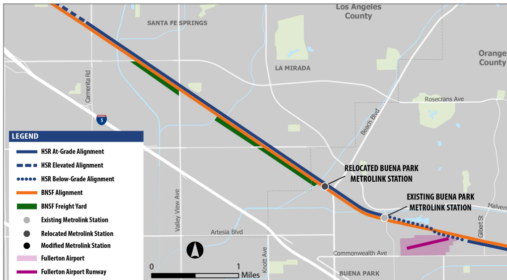
Reubicación de la Estación de Metrolink de Buena Park