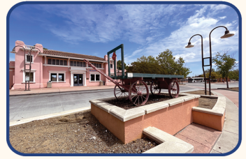
Estación de Gilroy

Como una estación intermodal de gran importancia, Diridon servirá como un enlace central con los servicios de Caltrain, BART (mediante una futura ampliación), el Corredor Express de Altamont (ACE), el tren Amtrak Capitol Corridor y la Autoridad de Transporte del Valle de Santa Clara (VTA), consolidando el tren de alta velocidad en el corazón de Silicon Valley.