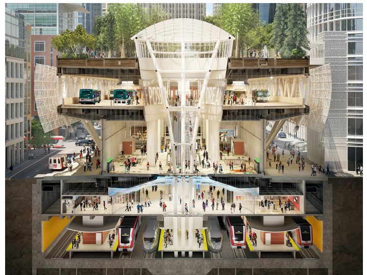
Una muestra con corte transversal representativa de los niveles del futuro Centro de Tránsito Salesforce.

La Autoridad junto con sus socios Caltrain, Autoridad de Transporte del Valle de Santa Clara (VTA), Comisión de Transporte Metropolitano (MTC) y la Ciudad de San José están colaborando en un plan de Servicio Integrado para la Estación de Diridon (DISC). La estación de Diridon se perfila para convertirse en uno de los centros intermodales más concurridos en la costa oeste de los Estados Unidos.