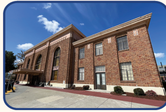
Estación de Diridon

La estación multimodal prestará servicio al condado de San Mateo y ofrecerá acceso conveniente al aeropuerto más grande y con mayor tráfico de la región, el Aeropuerto Internacional de San Francisco (SFO, por sus siglas en inglés). Además, integrará la conexión con dos de los principales sistemas de transporte regionales, BART y Caltrain, así como con el servicio de autobuses locales.