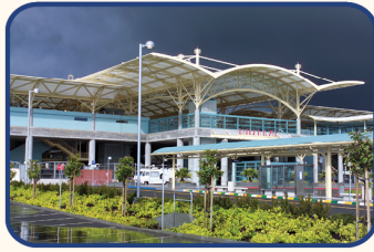
Estación de Millbrae-SFO

La futura terminal norte del sistema del tren de alta velocidad en California, el Centro de Transito Salesforce (Salesforce Transit Center, en inglés), actualmente ya presta servicio a líneas de autobuses locales y regionales. Debajo del edificio se construyó una estructura ferroviaria subterránea que permanece en espera para la futura llegada del servicio de Caltrain y del tren de alta velocidad.